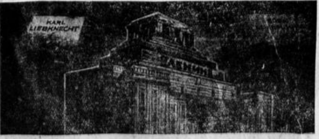
Н. Ленина, К. Либкнехта и Р. Люксембург. (Из журнала немецких деткомгрупп „Юный Спартак“).